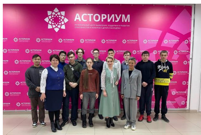
Образовательный центр «Асториум»