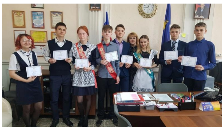
Лучшие учащиеся инженерного класса