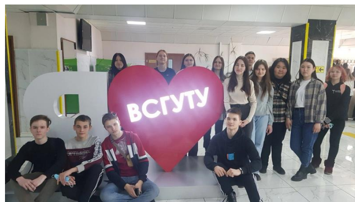
Экскурсия во ВСГУТУ