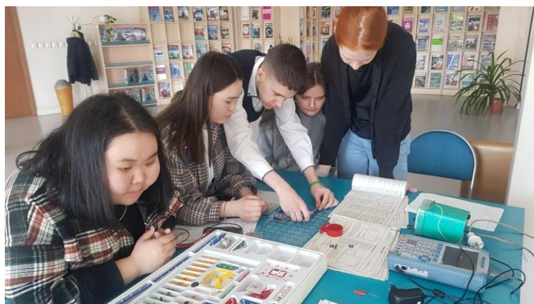
Проф.пробы по радиотехнике