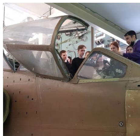
Проф.пробы по авиастроению