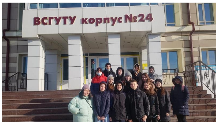
Экскурсия во ВСГУТУ