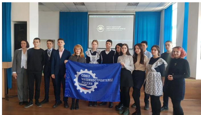
Встреча с сотрудниками АО «У-УАЗ»